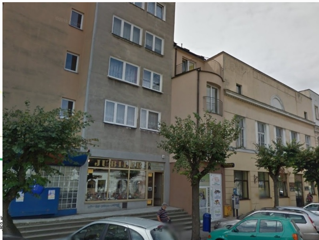
widok na elewację od frontu