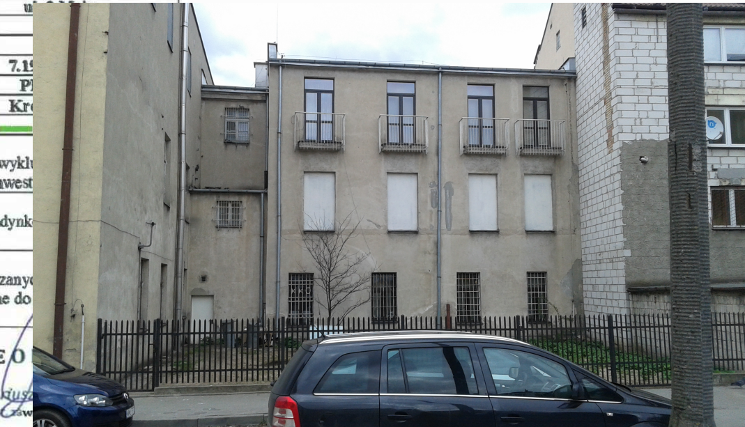
widok na elewację od podwórza

TOWYCH .6640.011.510.2017 mlawski 141301 1 m. Mława 0010