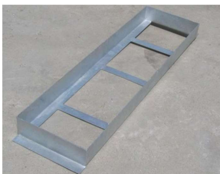
Fot. – Skrzynka do mocowania belki do skoku w dal – zdjęcie poglądowe