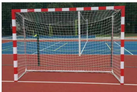
Fot. - Bramka o wymiarach 3x2m - zdjęcie poglądowe