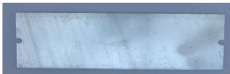
Fot. – Skrzynka do mocowania belki do skoku w dal – zdjęcie poglądowe

Zeskok w postaci piaskownicy o szerokości 275cm (między wewnętrznymi krawędziami obudowy zakończonej obrzeżem systemowym) oraz o długości 7 m.