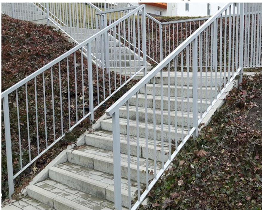
Fot. – Barrierki przyschodowe – zdjęcie poglądowe

Projektuje się barierki schodowe ze stali ocynkowanej, malowanej proszkowo w kolorze RAL 6005.