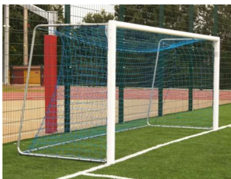
Fot. Bramka na boisko wielofunkcyjne - zdjęcie poglądowe

Fundament pod słupki bramki – o wymiarach min. 40x40x85cm, z betonu C25/30 (dopuszcza się równoważny sposób montażu bramki – wg zaleceń producenta).