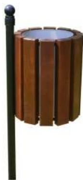
Fot. – Kosz na odpady – zdjęcie poglądowe