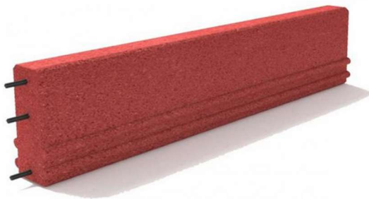
Fot. – Obrzeże gumowe SBR – zdjęcie poglądowe

Zeskok należy otoczyć systemowymi obrzeżami. Projektuje się elastyczne wzmocnione obrzeża gumowe SBR o wymiarach 1000 x 250 x 50 mm o właściwościach amortyzujących, antypoślizgowych, mrozoodpornych i wodoprzepuszczalnych. Kolor: czerwony. Obrzeże dedykowane dla budowy zeskoczni skoku w dal.