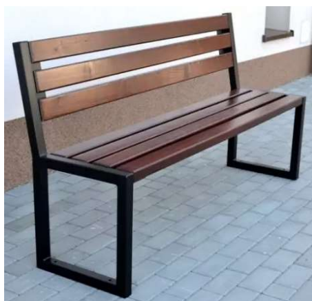
Fot. – Ławka – zdjęcie poglądowe