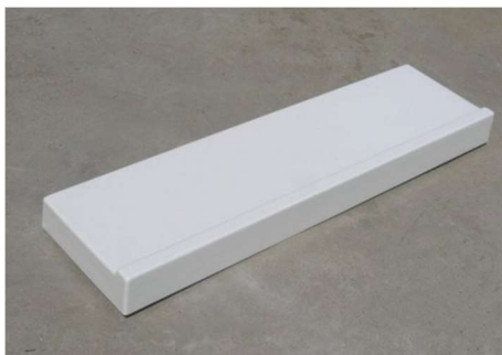
Fot. – Belka do skoku w dal – zdjęcie poglądowe