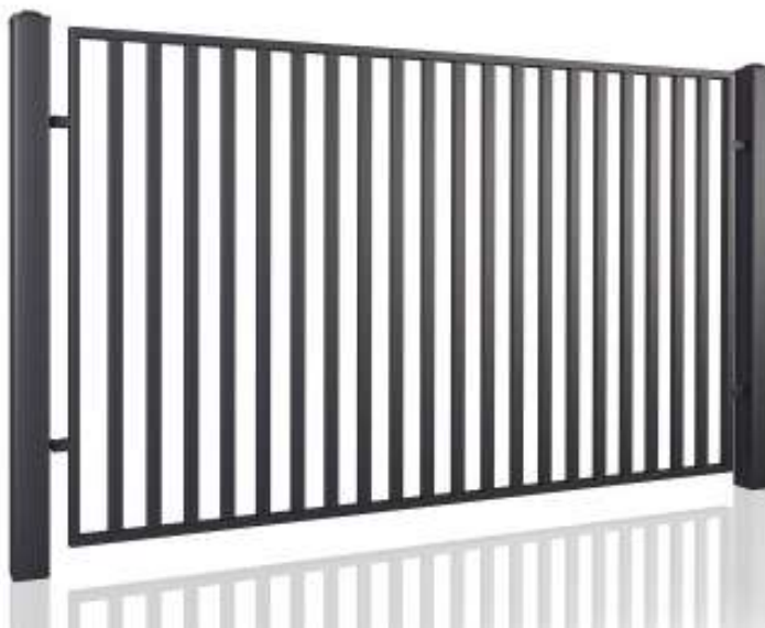
Fot. – Ogrodzenie panelowe – zdjęcie poglądowe