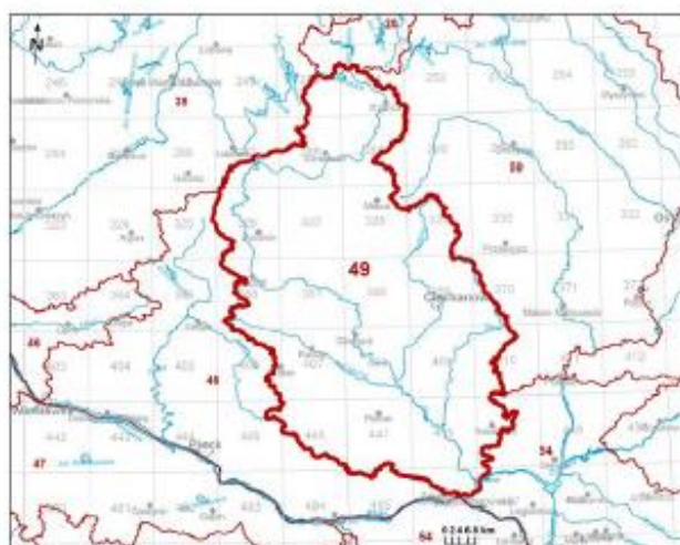
Mapa z lokalizacją JCWPd