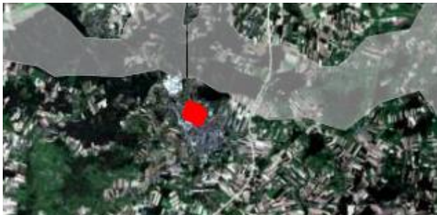
Rys.1 Położenie terenu opracowania na tle regionalnych korytarzy ekologicznych

Teren opracowania położony jest około 2 km na [południe od regionalnego korytarza ekologicznego Puszcza Biała – Dolina Drwęcy, którego przebieg został wskazany na stronach Geoserwisu GDOŚ (Rys.1).