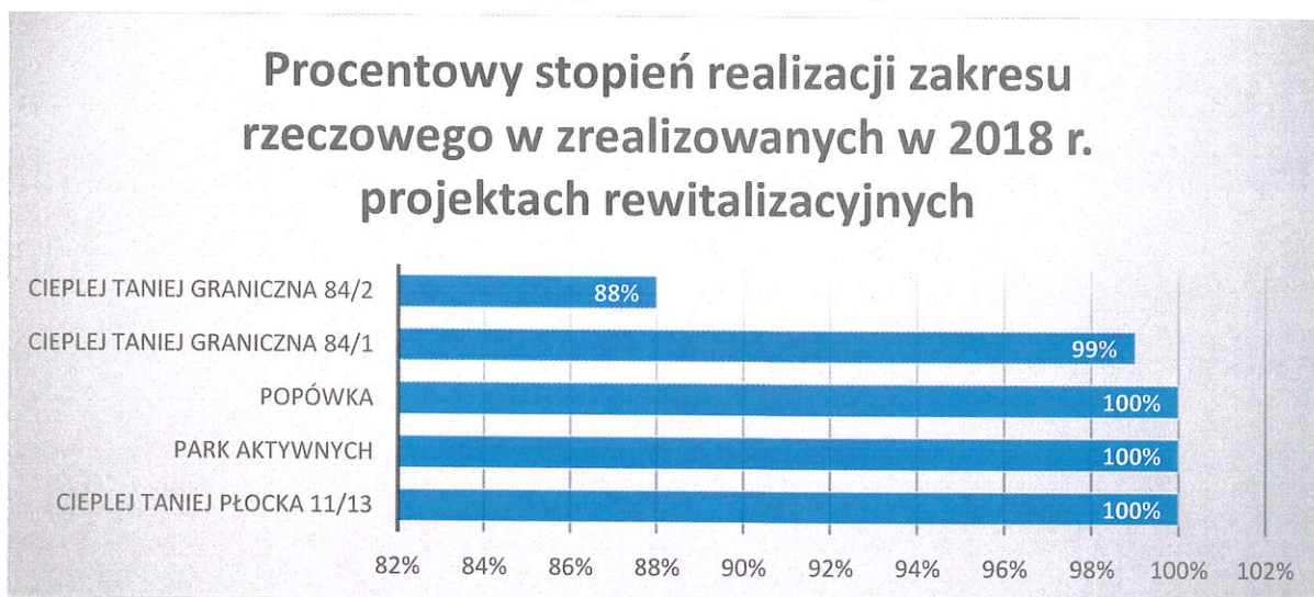
Wykres 1 Procentowy stopień realizacji zakresu rzeczowego