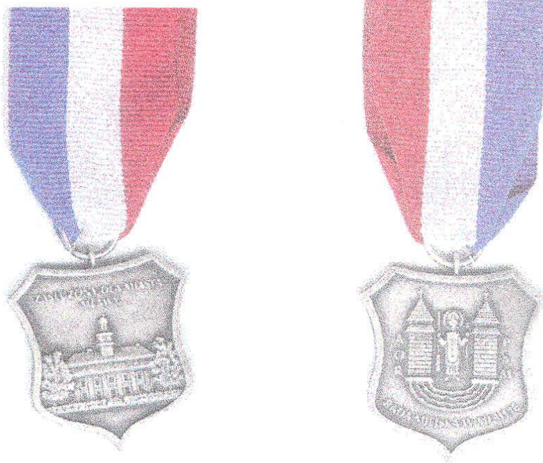
„ZASŁUŻONY DLA MIASTA MŁAWA”